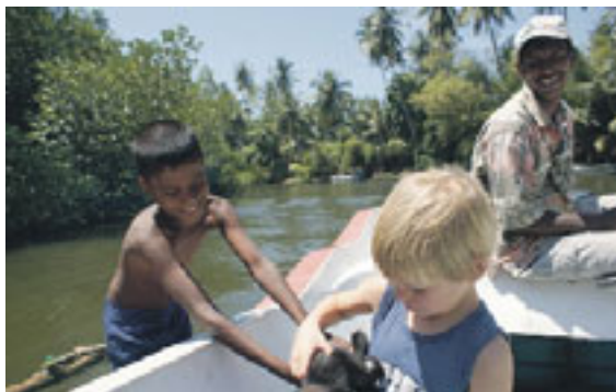
Badderende olifanten in een rivier bij Pinnawela (boven) en een aapje in de boot.

Dat is volgens hem ook de reden waarom de theeblaadjes in het voormalige Brits Ceylon nog met de hand van de theestruik worden geplukt. Altijd zo gedaan, waarom veranderen? Ik zie kromgetrokken vrouwtjes met manden op hun rug klauteren over de steile theeheuvels nabij de magnifieke bergsteden Nuwara Eliya en Kandy.