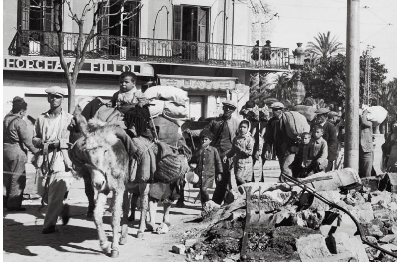
SPAANSE BURGEROORLOG VLUCHTELINGEN KEREN TERUG NAAR MALAGA NA DE BEZETTING DOOR DE NATIONALISTEN 16 februari 1937.

Het was dan ook van haar geliefde moeder dat Gellhorn in 1929 een treinkaartje kreeg naar New York, waar ze aan boord stapte voor de overtocht naar Parijs. De Franse hoofdstad werkte in die dagen als een magneet op schrijvers, artiesten en kunstenaars uit alle windstreken. Ook op Gellhorn, die droomde van een leven als schrijfster en de universiteit voortijdig had verlaten voor een baan als leerling-verslaggeefster bij een lokale krant. Twee koffers