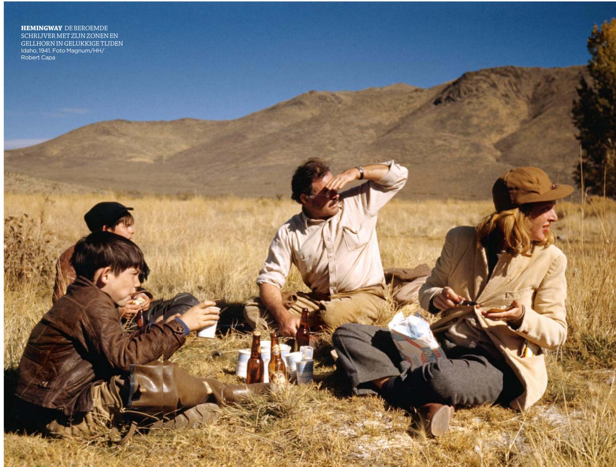
HEMINGWAY DE BEROEMDE SCHRIJVER MET ZIJN ZONEN EN GELLHORN IN GELUKKIGE TIJDEN Idaho, 1941.

'Bij alles ter wereld kan ik me neerleggen, behalve bij saaiheid'