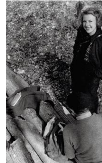
EERSTE OORLOG HEMINGWAY EN GELLHORN IN SPANJE, CA. 1937-'38 Gellhorn genoot van de jongensachtige kameraadschap onder de journalisten.

ook weleens heeft afgevraagd of ze als vrouw wel geschikt was voor de oorlogsjournalistiek, nam haar werk alle mogelijke twijfel weg. Gellhorn groeide uit tot een naam, en bewees dat een vrouw even goed – ja, soms zelfs beter dan mannen – een oorlog kan verslaan.