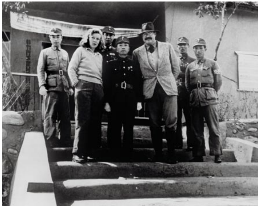
GRUWELREIS MARTHA EN HEMINGWAY IN CHINA TIJDENS DE CHINEES-JAPANESE OORLOG 1941.

Eenmaal in Europa trok Gellhorn vanaf 1944 van plek naar plek. Ze erkende later dat ze als jonge vrouw dingen gedaan