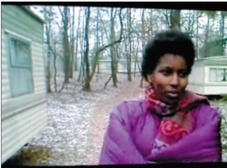
Hirsi Ali in het opvangcentrum