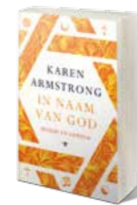
Karen Armstrong, In naam van God. Religie en geweld . Bestellen? Kijk op p. 74-75.

Midden-Oosten. De grote moordpartijen vinden onder moslims zelf plaats. Neem nou de onderlinge strijd tussen de sjiïeten en de soennieten.'